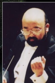
音楽監督・指揮者 声楽家(二期会会員)