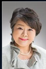
第82回日本公衆衛生学会 総会会長